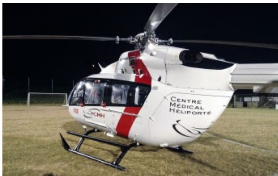
► Vue nocturne de l'hélicoptère du CMH posé sur un terrain éclairé (Ferrières)